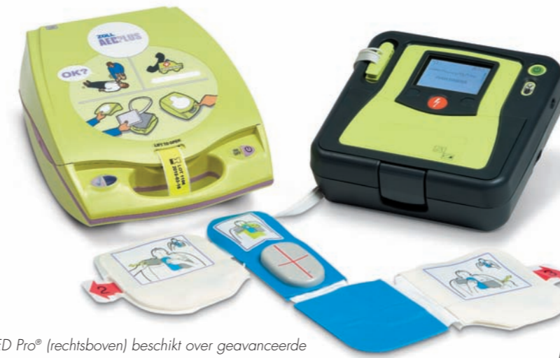
De AED Pro® (rechtsboven) beschikt over geavanceerde functies voor zowel gebruikers die basisreanimatie toepassen als gebruikers die verder gaande reanimatietechnieken toepassen, zoals ECG-bewaking en handmatige defibrillatie.

Voor adressen en faxnummers van dochterondernemingen en voor andere locaties over de hele wereld: www.zoll.com/contacts.